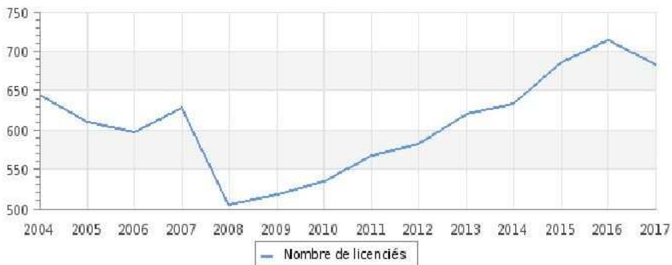
Evolution du nombre de licenciés dans le département